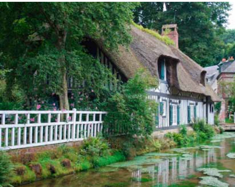
Veules-les-Roses (GR 21).