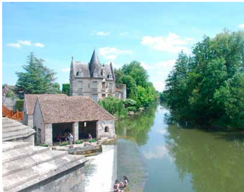
Moret sur Loing (GR 11).