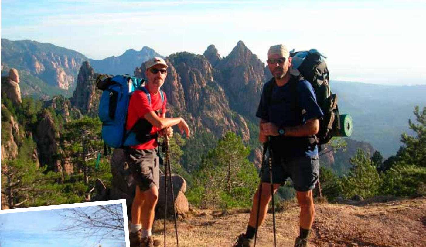
De onvermijdelijke GR 20 op Corsica.