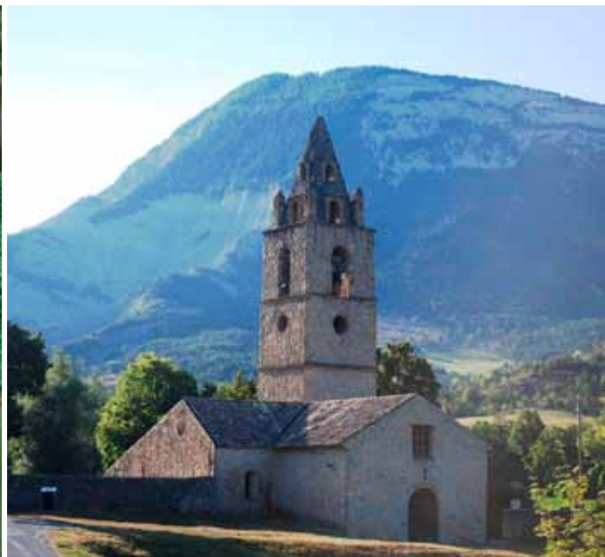
Tartonne op de Grand Traversée des Pré-Alpes.