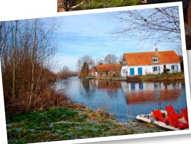
Clairmarais (GR 128).

Wanneer je iemand kruist, krijg je bijna altijd een 'bonjour'. Ik belandde ooit op het parcours van een mountainbiketocht. Honderden bikers in volle inspanning, maar honderden keer 'bonjour'. Uitbaters van gîtes d'étape of mensen met een chambre d'hôtes vinden het evident om snel even je natte kleren te wassen of je naar een bushalte te brengen. Natuurlijk gebeurt dat ook in Vlaanderen, maar in Frankrijk veel vaker. Onlangs passeerde ik een verlaten dorp ergens in het zuiden, langs GR 4. Het gemeentebestuur had er tussen de ruïnes nog een schuilhut ingericht. Er hing een briefje aan de deur dat begon met 'chers randonneurs'. Je moest er niet betalen, enkel de houtvoorraad weer aanvullen. Dat is Frankrijk ten voeten uit.